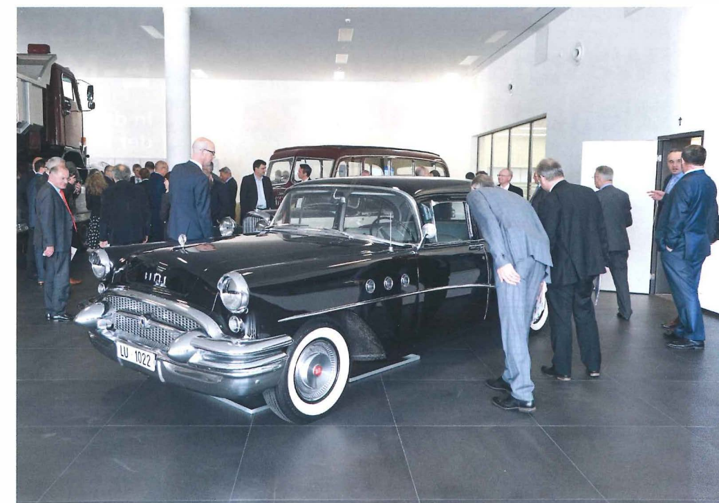
Die Oldtimer-Sammlung war natürlich ein Anziehungspunkt.