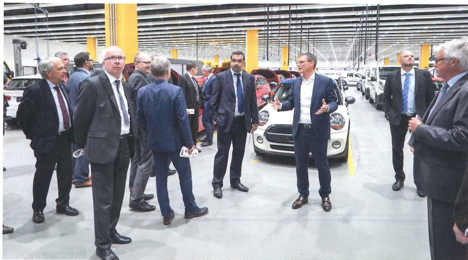
Mehr als nur Autospediteur: Ein- und Umbauten sowie Aufbereitung von Neuwagen sind dabei.